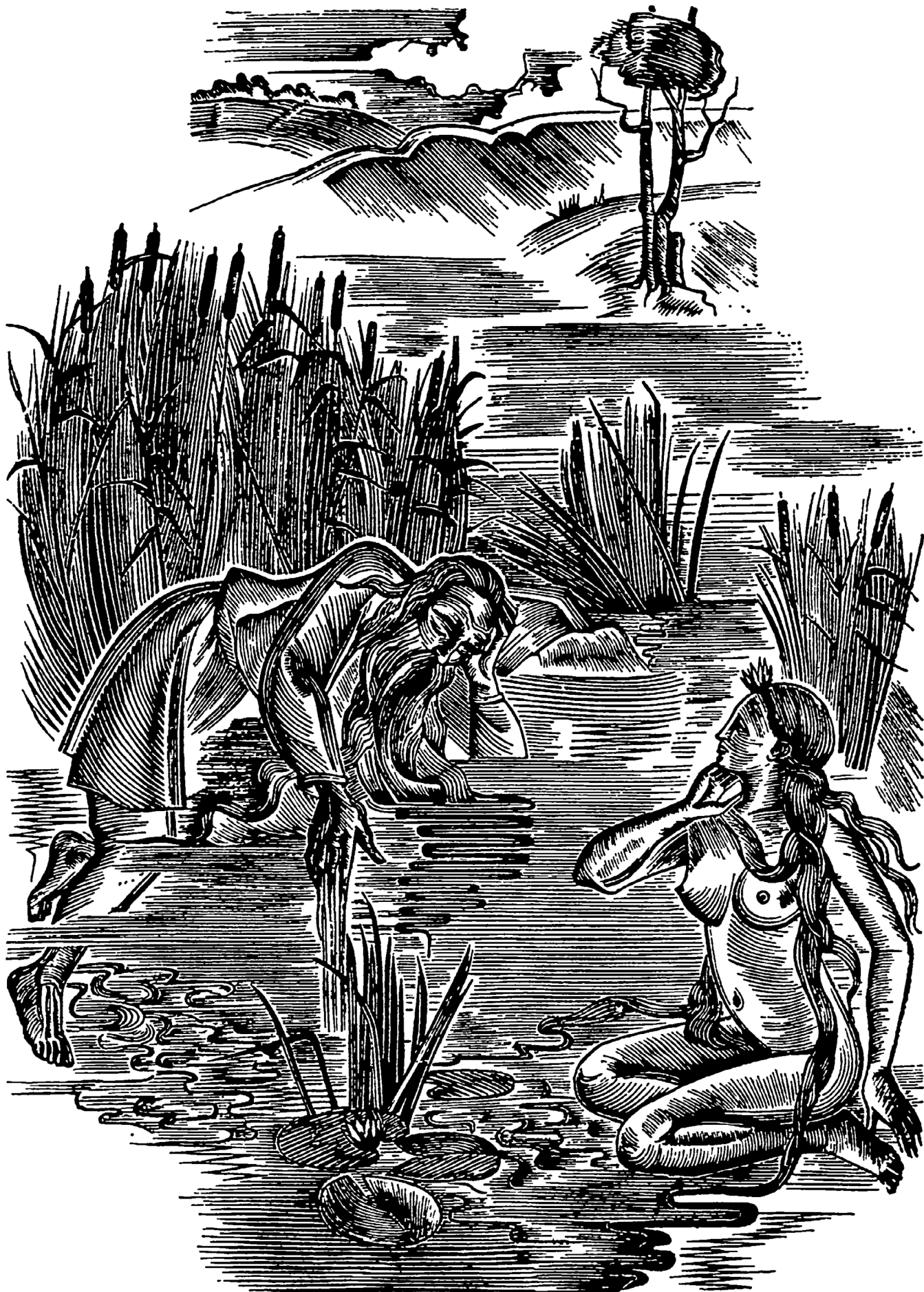
ILLUSTRATION DE OLÈNA SAKHNOVSKA (1973)