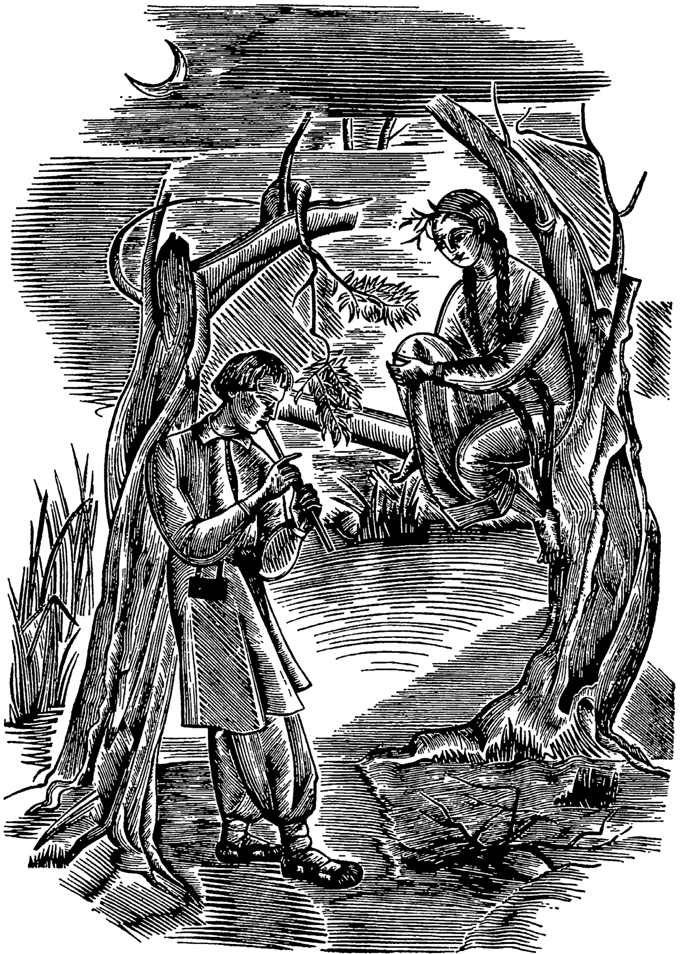
ILLUSTRATION DE OLÈNA SAKHNOVSKA (1973)