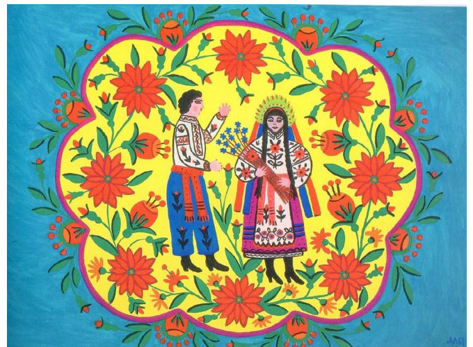
© Lin fleuri et cosaque se rendant chez une jeune fille , de Maria Prymachenko (1982)

Le projet permettra aussi la circulation des publics, la transmission d'un processus de création et la démarche de spectateur·trice qui se jouent. En effet, la pratique artistique n'est pas toujours synonyme de la fréquentation des lieux de création et de diffusion. En prolongement des rencontres entre les différents groupes de jeunes, les participant·e-s rencontreront également les adolescent·e-s-spectateurs·trices du festival, découvriront les autres artistes et spectacles, et pourront avoir un retour sur leur travail, via les nombreuses tables rondes et bords plateaux organisés. Un véritable parcours d'acteur·trice-spectateur·trice se mettra en place pour ces jeunes.